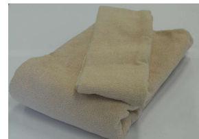
【バスタオル・フェイスタオル】