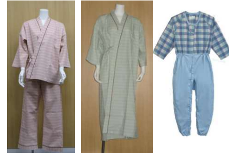
【甚平】 【浴衣】 【介護寝巻】