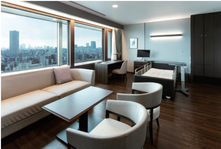
Phòng bệnh đặc biệt

Giới thiệu phòng bệnh Chúng tôi chuẩn bị các phòng riêng với nhiều loại và kích thước khác nhau.