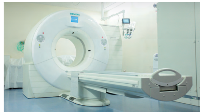
Trang bị đầy đủ các thiết bị y tế tối tân như MRI, CT, PET, v.v..