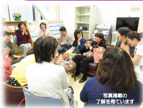
写真掲載の 了解を得ています