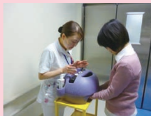
看護の日には、患者 さんにも体験してもらいます

私達は、感染を防止し、患者さんへは安 全な療養環境を、スタッフには安心して働 ける職場環境になることを目指し、日々活 動しています。