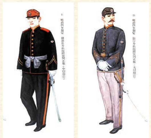
左/当時の軍医の制服(中尉相当) 右/当時の軍医の制服(大尉相当)

当時、皇居を取り囲んで陸軍の諸機関が次々に整備されていきました。前述の病院を含めて記録に残る限りで1873年までに8個の仮病院が設置されました。しかし、仮病院という名の通り、一時しのぎの施設だったようです。設置及び閉鎖の日時を除き、ほとんど記録が残っていません。