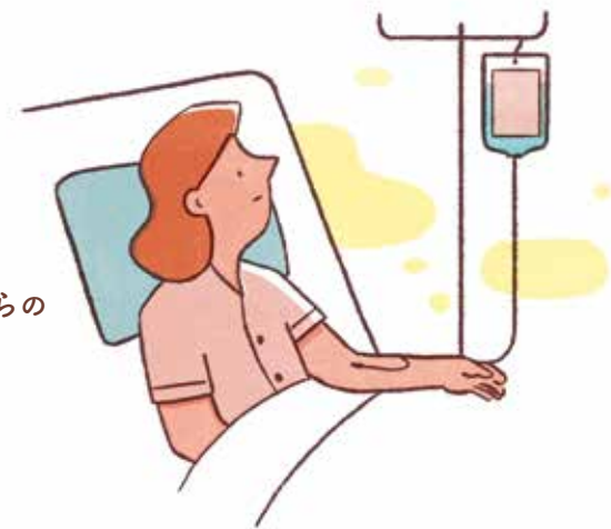
末梢静脈からの点滴

点滴の場合は、腕の細い血管から点滴する方法と、鎖骨の下や首の横などからカテーテルを入れて心臓に近い太い血管から点滴する方法（中心静脈カテーテル・中心静脈ポート）があります。