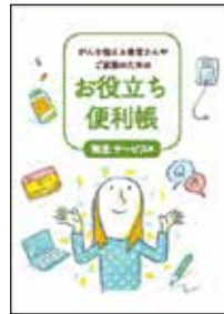
がんを抱える 患者さんや ご家族のための お役立ち便利帳 制度・サービス編