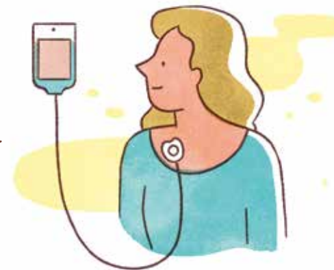
中心静脈ポートを使用した点滴