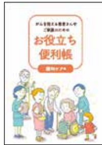
がんを抱える 患者さんや ご家族のための お役立ち便利帳 緩和ケア編