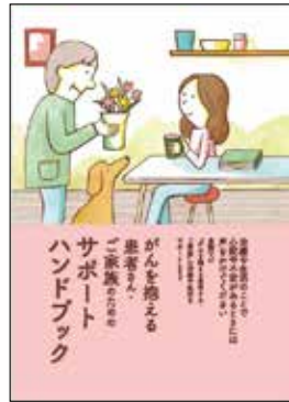
がんを抱える 患者さん・ご家族のための サポートハンドブック