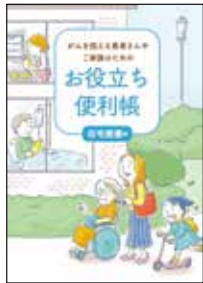
がんを抱える 患者さんや ご家族のための お役立ち便利帳 在宅療養編