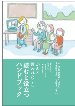
がんと言われたときに 読むと役立つ ハンドブック